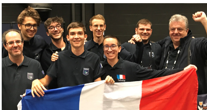
L'équipe de France U26 Open, championne d'Europe 2022.

En compétition, les USA et l'Europe dominent alternativement la planète bridge. Longtemps, les Italiens ont disputé aux Américains la suprématie mondiale, tandis que la France a fait cavalier seul dans les années 90. La Chine s'est affirmée depuis une vingtaine d'années comme une réelle puissance sur la scène internationale.